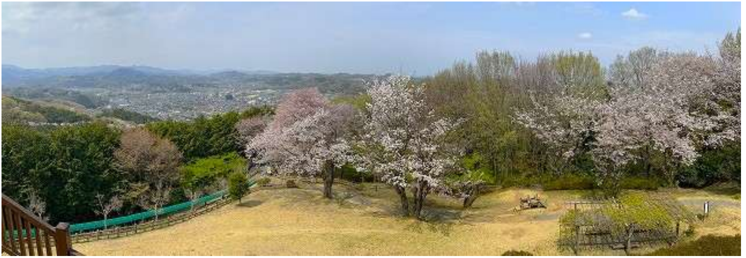
展望台から小川町を見下ろす