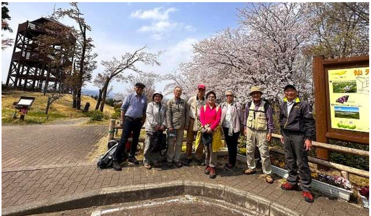
見晴らしの丘公園にて記念撮影