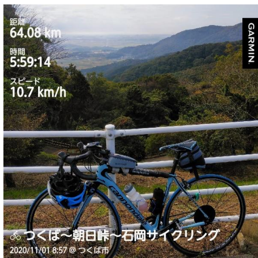
朝日峠駐車場より関東平野を望む

令和2年11月1日(日)晴 CANNONDALE SYNAPSE CARBON UL TEGRA 岩田