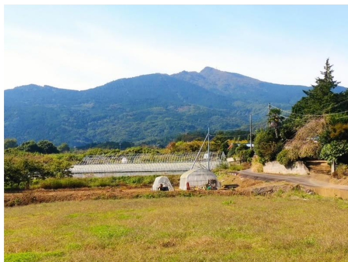
石岡市郊外より筑波山を望む

記録： 9:00TX つくば駅 標高 25m→桜川 栄利橋 2m→9:39～52 小町の里 12.66 km 40 m→10:24 表筑波スカイライン・フルーツライン分岐→10:26～52 朝日峠駐車場 17.78 km 308 m→茨城県フラワーパーク 30m→12:24 加波山神社 39.50 km 46m→12:38～52 恋瀬の里 41.51 km→12:58～13:08 善光寺楼門 42.69 km 70m→13:38 ギター文化館 50.76 km→14:23～50 常陸国総社宮 61.85 km 20m→14:56JR 石岡駅 63.32 km 20m