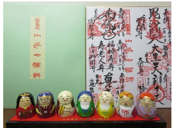
御朱印色紙・達磨