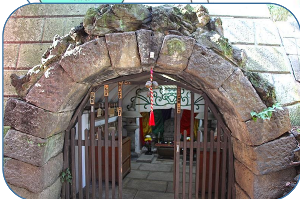
ばん龍寺・岩屋弁財天